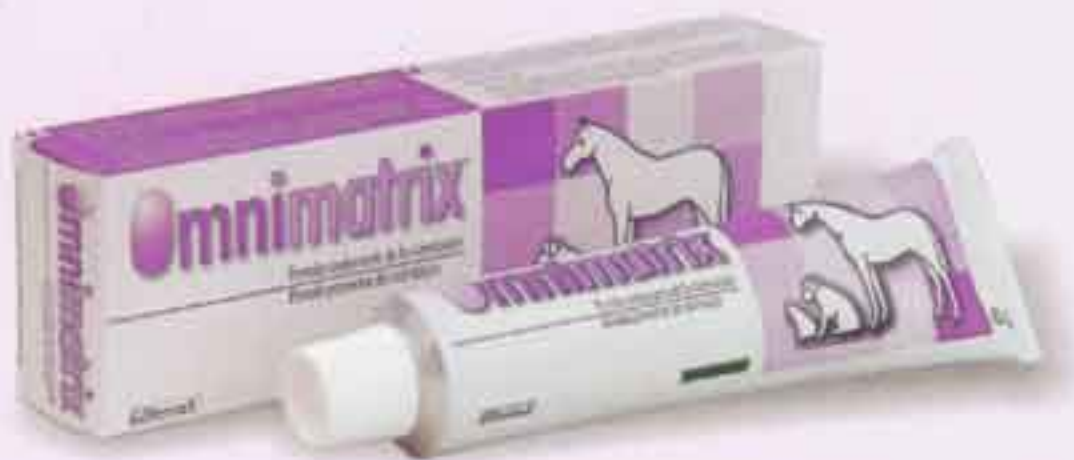
Presentación: Tubo con 60g de crema