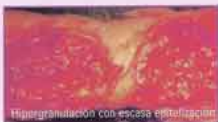
Hipergranulación con escasa epitelización

1. Promotor de la cicatrización de heridas, abrasiones cutáneas, perdidas extensas de piel, quemaduras, úlceras, dermatitis supurativas superficiales, rozaduras, heridas con exceso de granulación ( proud flesh )