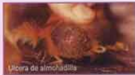
Úlcera de almohadilla