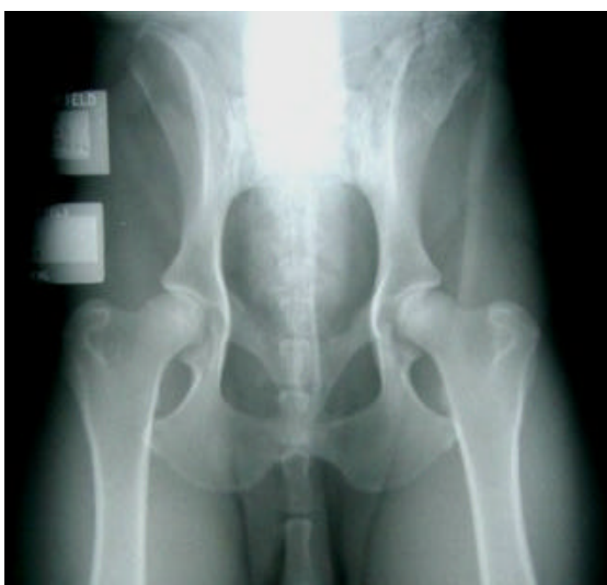
Anca com boa conformação e sem problemas