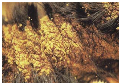
Aspecto geral e detalhe da dermatose responsiva à Vit. A

3. Zinco (480mg) para o tratamento da dermatose reponsiva ao Zn síndrome I (adultos, típica de raças nólicas, dermatose facial e hiperqueratose, tratamento para o resto da vida) e síndrome II (cachorros de crescimento rápido, descamação, tratamento transitório).