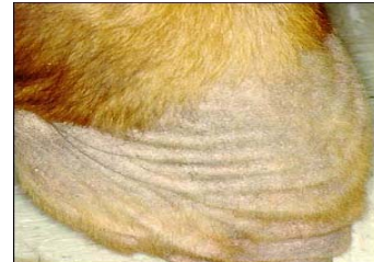
Dermatite alérgica à picada da pulga