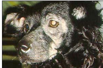
Alergia alimentar com o típico prurido à volta da face, olhos e patas