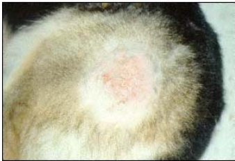
Pioderma (hotspot) por trauma auto-infligido

1. Ácidos gordos essenciais \Omega 3 , mas apenas os mais eficazes: EPA (11,8g) e DHA (7,7g). Estes são os únicos com efeito anti-inflamatório puro. Especialmente eficazes no protocolo de controlo de situações de atopia, DAPP, alergias de contacto, outras situações pruriginosas, piodermas e queda anormal de pêlo.