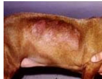
Atrofia da pele com alopecia por uso continuado de corticoides

2. Vitamina A (retinol, 30'000 U.I.) para o tratamento da dermatose responsiva à vitamina A, típica do Cockers e Labradores, e caracterizada por hiperqueratose oclusiva dos folículos e seborreia gordá.