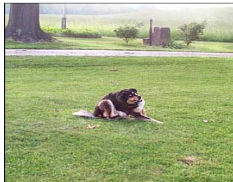
Situações pruriginosas em geral