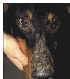
Aspectos mais comuns da dermatose responsiva ao Zn –I (adultos)